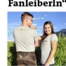
30 Gratis-FanleiberIn sind bereits unterwegs!